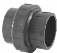
PVC холендър, Испания.