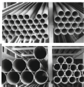
PVC тръба. Произведени в EU