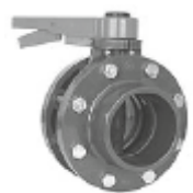
PVC кран пеперуда, Испания.