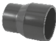
PVC редукция - конична, Испания.