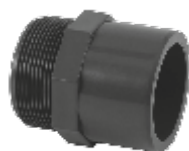
PVC нипел с външна резба, Испания.