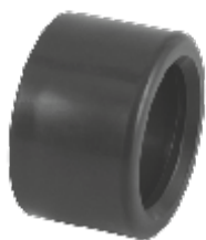
PVC редуќција - набивна, Испанија.