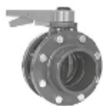
Кран перепруга, комплект с фланец - PoolZone.