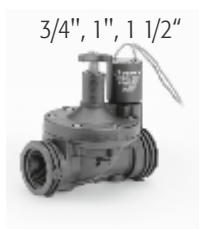
3/4", 1", 1 1/2"