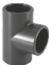
PVC тройник 90°, Испанија.