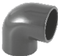
PVC коляно 90°, Испания.