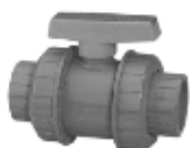
Кран - PoolZone.