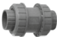
Обратен клапан - PoolZone.