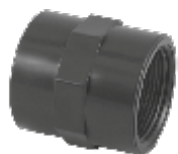
PVC нипел муфа с вътрешна резба, Испания.