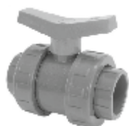
PVC кран сферичен, Испания.