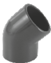
PVC коляно 45°, Испания.