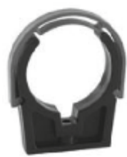
PVC скоба за тръба, Испания.