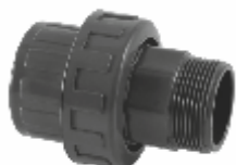
PVC холендър с външна резба, Испания.