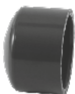
PVC тапа, Испания.